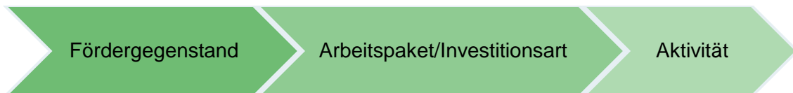
Abbildung 2: Ebenen des Projektinhalts

Die Darstellung des Projektinhalts gliedert sich in 3 Ebenen. Nach der Auswahl des Fördergegenstandes wird auf nächster Ebene das Arbeitspaket/die Investitionsart abgefragt. Auf der Ebene Arbeitspaket/Investitionsart müssen die Aktivitäten auf dritter Ebene ausgewählt werden.