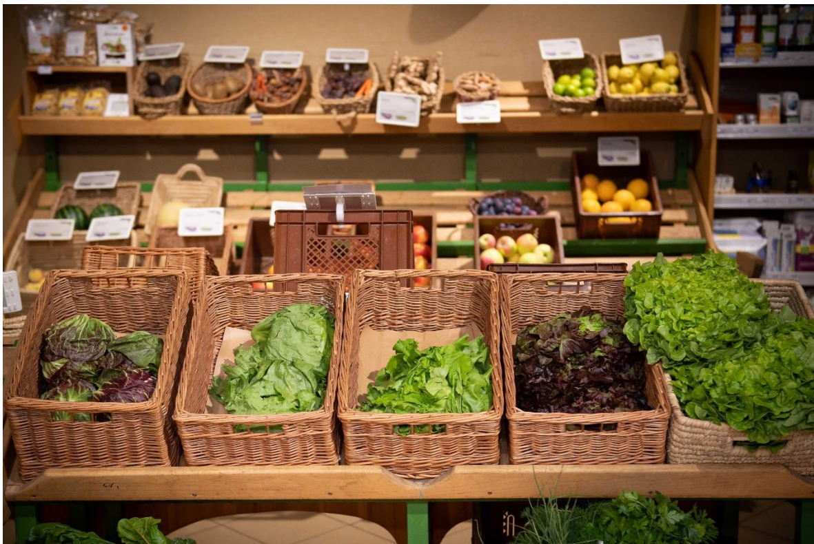
Abbildung 1: Ab-Hof-Obst- und Gemüseverkauf

Fördermaßnahme „Investitionen in Diversifizierungsaktivitäten inklusive Be- und Verarbeitung sowie Vermarktung landwirtschaftlicher Erzeugnisse (73-08)“ des GAP-Strategieplan Österreich 2023–2027