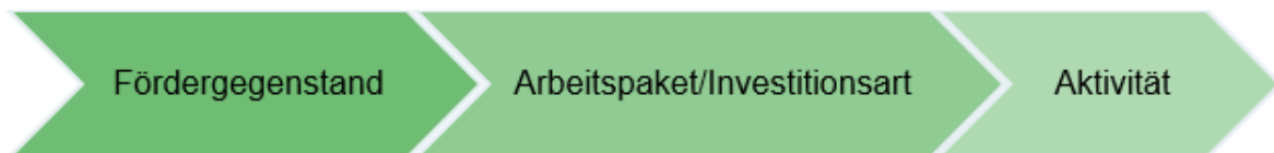
Abbildung 3 Ebenen des Projektinhalts

Die Darstellung des Projektinhalts gliedert sich in 3 Ebenen. Nach der Auswahl des Fördergegenstandes wird auf nächster Ebene das Arbeitspaket/die Investitionsart abgefragt. Auf der Ebene Arbeitspaket/Investitionsart müssen die Aktivitäten auf dritter Ebene ausgewählt werden.