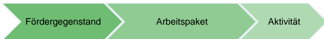
Abbildung 1: Ebenen des Projektinhalts

Die Darstellung des Projektinhalts gliedert sich in 3 Ebenen. Nach der Auswahl des Fördergegenstandes wird auf nächster Ebene das Arbeitspaket abgefragt. Auf der Ebene Arbeitspaket müssen die Aktivitäten auf dritter Ebene ausgewählt werden.