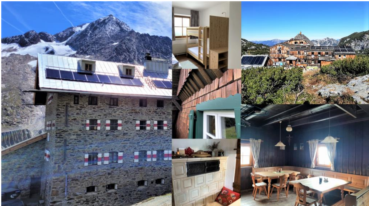
Abbildung 1: Schutzhütten; Quelle: BMAW

Fördermaßnahme „Investitionen im Bereich kleine touristische Infrastruktur mit Fokus auf alpine Infrastruktur mit touristischer Relevanz (73-16)“ des GAP-Strategieplan Österreich 2023–2027