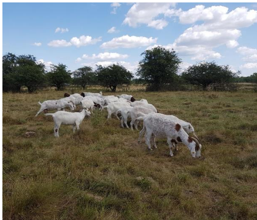
Investive Maßnahmen zur Verbesserung oder Wiederherstellung wertvoller Lebensräume