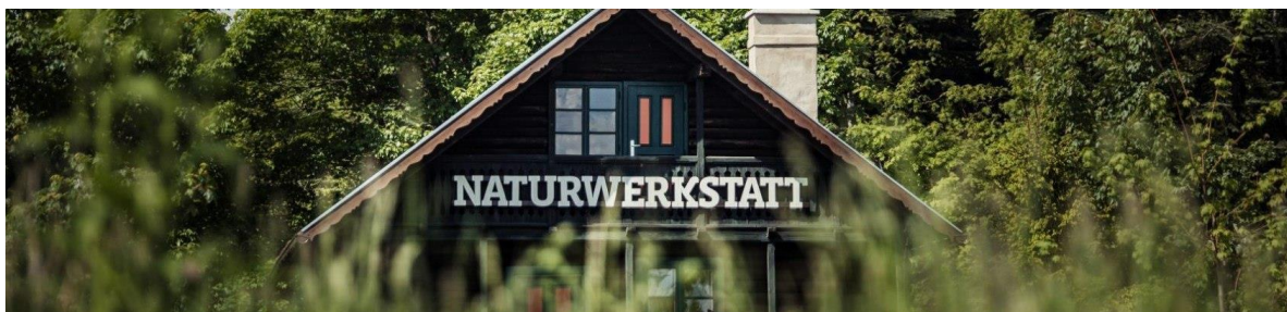
Infrastrukturen für Bewusstseinsbildung/Wissensvermittlung