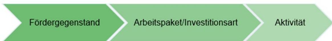
Abbildung 3: Ebenen des Projektinhalts

Die Darstellung des Projektinhalts gliedert sich in drei Ebenen. Nach der Auswahl des Fördergegenstandes wird auf nächster Ebene das Arbeitspaket/die Investitionsart abgefragt. Auf der Ebene Arbeitspaket/Investitionsart müssen die Aktivitäten auf dritter Ebene ausgewählt werden.