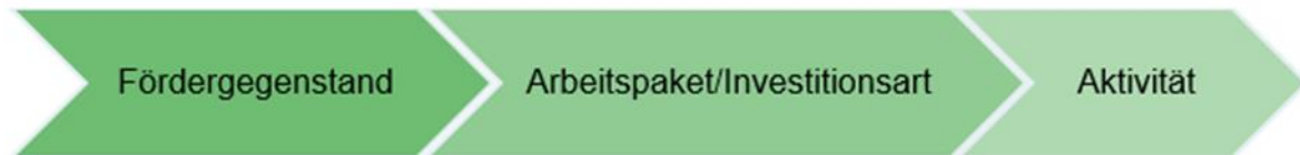
Abbildung 2 Ebenen des Projektinhalts

Die Darstellung des Projektinhalts gliedert sich in drei Ebenen. Nach der Auswahl des Fördergegenstandes wird auf nächster Ebene das Arbeitspaket/die Investitionsart abgefragt. Auf der Ebene Arbeitspaket/Investitionsart müssen die Aktivitäten auf dritter Ebene ausgewählt werden.