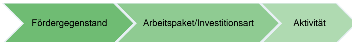
Abbildung 2: Ebenen des Projektinhalts

Die Darstellung des Projektinhalts gliedert sich in 3 Ebenen. Nach der Auswahl des Fördergegenstandes wird auf nächster Ebene das Arbeitspaket/die Investitionsart abgefragt. Auf der Ebene Arbeitspaket/Investitionsart müssen die Aktivitäten auf dritter Ebene ausgewählt werden.